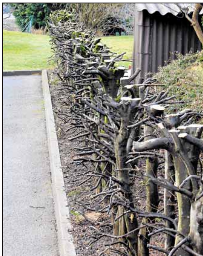
Une taille drastique effectuée en hiver sur des charmilles n'y paraît plus après deux ans. Privilégiez néanmoins la régularité pour éviter d'en arriver là... JLP