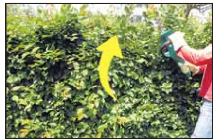
Monsieur Maugré fait joujou avec son taille-haie. Observez le mouvement de balancier de bas en haut avec les bras près du corps. JLP