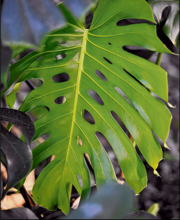
Le feuillage unique par ses perforations originales rend le Monstera deliciosa incontournable des grands espaces à vivre. En plus, cette plante est réputée dépolluante, monstre bien! JEAN-LUC PASQUIER