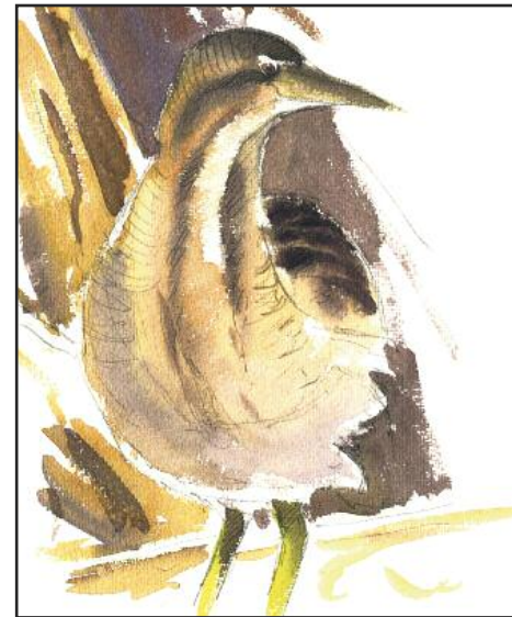
Le butor étoilé.

> Séance de dédicace, samedi 15 décembre de 10 h à 12 h à la librairie Payot, Fribourg