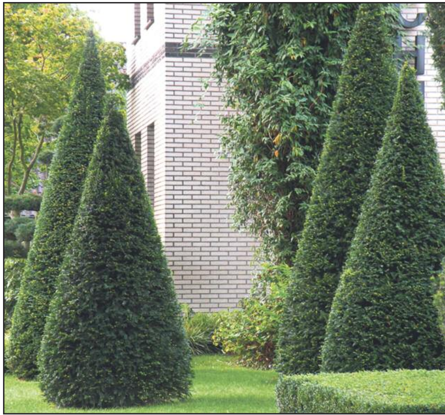
Les ifs sont toujours verts et agréablement dociles, faut juste pas leur croquer les graines... JEAN-LUC PASQUIER