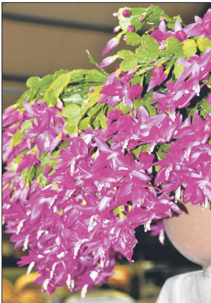
Le cactus de Noël a besoin d'une période de repos durant l'hiver après son abondante floraison.