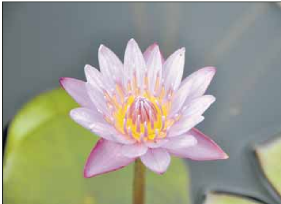
Non pas «King of the Pop» mais «King of the Blues»: le doux nom d'une nymphaea hybride. J.L.P

Les fleurs de nénuphars en ont déjà entraîné plus d'un dans l'eau. C'est normal, leur beauté est tout simplement irrésistible. Les Allemands les surnomment «Seerose» ou rose de lac, en l'hommage à la noblesse de ces sirènes des eaux. Les botanistes quant eux, un soir de grande beuverie, ne s'y sont pas trompés: ils les ont dénommées «Nymphaea» en l'hon-