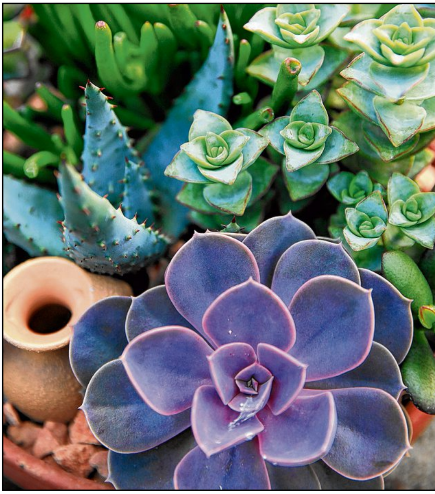
Les succulentes sont parfaites quand on n'a pas la main verte: moins on en fait, mieux elles se portent.